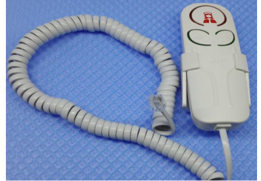
Şekil 10: Ürün teste hazırdır.