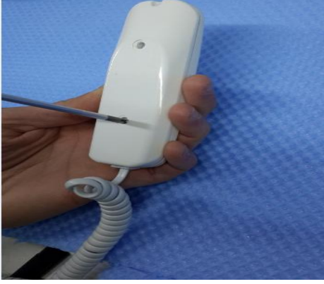
Şekil 7: Ön ve arka kapak montajı yapılır.