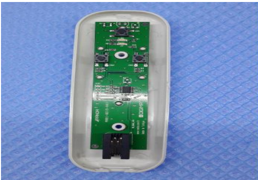
Şekil 3: PCB kartı arka kapağa yerleştirilir.