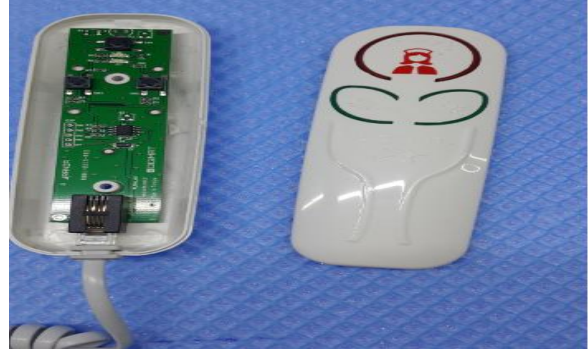
Şekil 6: Ön ve arka kapak görüntüsü. (RND 19)