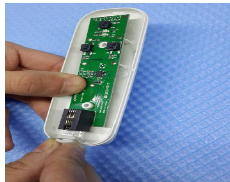
Şekil 4: Cihaz kablo bağlantısı yapılır.