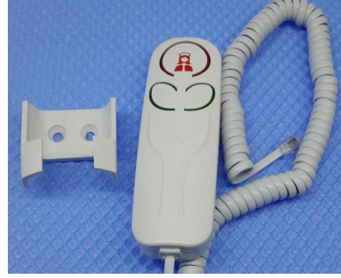
Şekil8: Cihazın tamamlanmış görüntüsü..