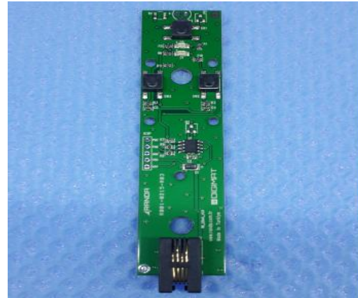
Şekil 1: Cihazın ön ve arka kapağı görüntüsü.(RND 21- RND 22) Şekil 2: PCB kartının görüntüsü.