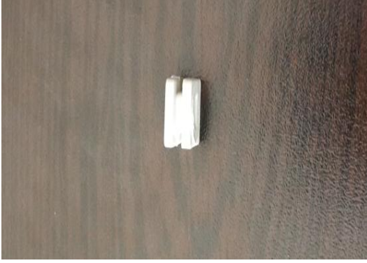
Şekil 5: Kablo esnekliği için gromet eklenir.